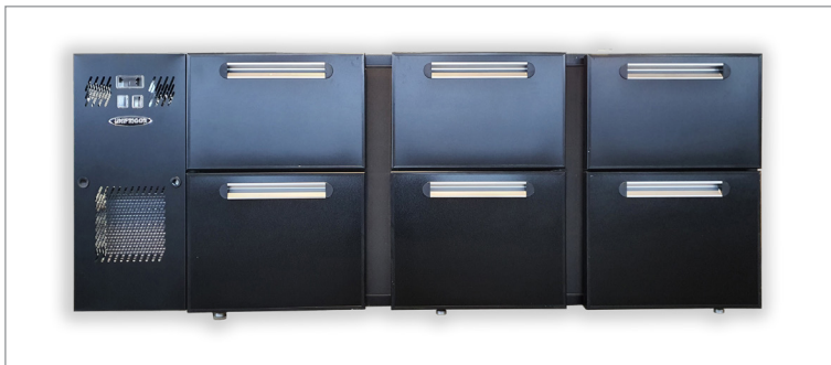
Model RO 2140 3DX antracitgrå skinplade - UNIBAR kølebord med indbygget kompressor og 6 skuffer for danske ølkasser.