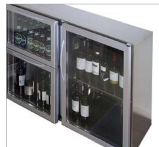
Unibar ECO fås også med glasskuffer.

Kølemiddel: R290 for modeller med indbygget kompressor. Modeller for separat kompressor leveres med styring og termoventil for R134A. Ekskl. magnetventil.