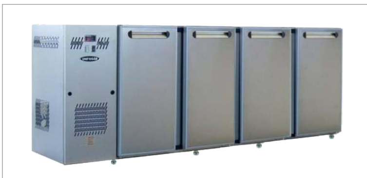
Model RO 2140 3DX rustfrit - UNIBAR kølebord med indbygget kompressor og 4 døre