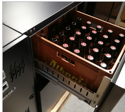
Skuffe for dansk ølkasse. Skuffen er forsynet med stabile teleskop-skiner med fuldt udtræk, så håndteringen af ølkasserne lettes.

Kompressorsektionen er forsynet med en hængslet låge, så det er let at tilgå kompressor og kondensator – ved den periodiske rensning. Styring og on/off knap er placeret bag et gennemsigtigt cover øverst på døren. Denne placering beskytter delene mod fugt og forlænger levetiden.