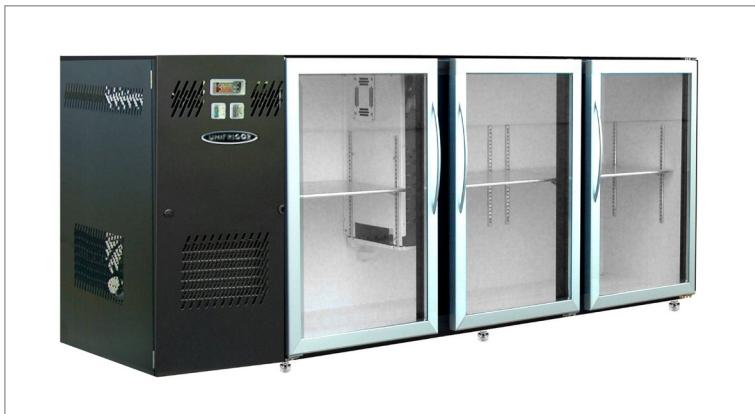
Unibar ECO RO 2140 3DXG skinplate med indbygget kompressor.